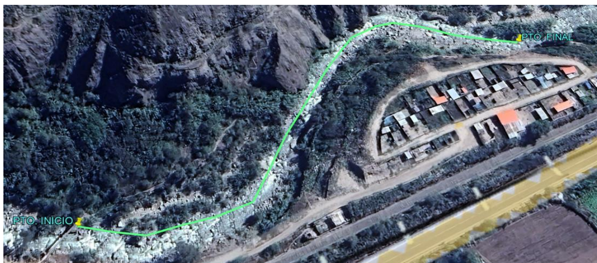
5.- IMAGEN SATELITAL DE ZONA VULNERABLE